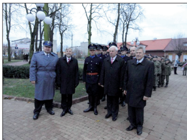
Przed pomnikiem Marszałka Józefa Piłsudskiego