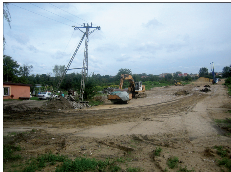
Trwają przygotowania podłoża pod budowę obwodnicy