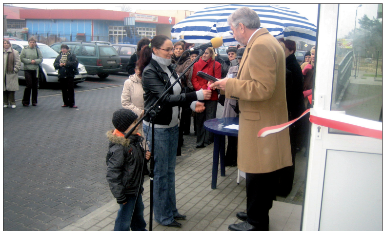
Szczęśliwa mieszkanka otrzymuje klucze do nowego mieszkania