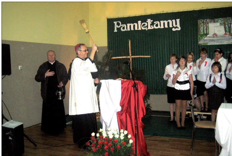
Poświęcenia dokonuje biskup płocki Piotr Libera

W 1939 r., okupant niemiecki po zajęciu Gostynina uwięził dużą grupę mieszkańców miasta, głównie spośród inteligencji. Po przesłuchaniach 1 grudnia o świcie hitlerowcy załadowali 29 osób do podstawionych samochodów ciężarowych i wywieźli ich do lasu w Woli Łąckiej na stracenie. Prowadzonych od szosy do miejsca egzekucji bito, a zanim ich rozstrzelano i zakopano w rowie, związani zostali parami drutem kolczastym. Miejsce zbrodni Niemcy starannie zamaskowali.