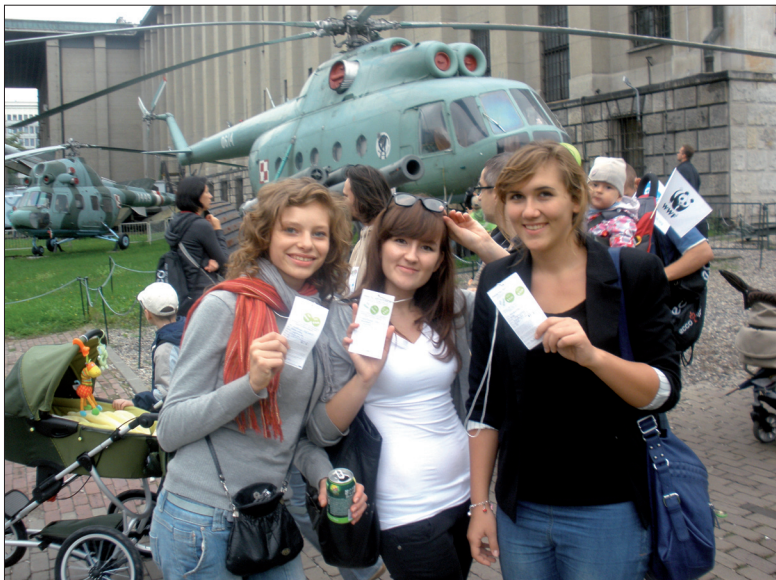
Zdjęcie naszych rekordzistek przy punkcie kontrolnym, który znajdował się w Muzeum Wojska Polskiego w Warszawie

osobom chorym na nowotwory, które wspierała fundacja TVN. Po konsultacji z opiekunami wyruszyliśmy w drogę, by pokonać wybrany przez siebie szlak. Większość z nas wybrała dłuższą o 10 km trasę, jednak znaleźli się też i tacy, którzy woleli przejść krótszy o 4 km dystans, by mieć więcej czasu na atrakcje przewidziane przez orga-