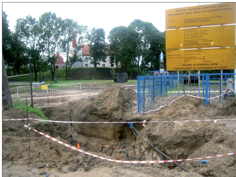
Wykopy przed gostyńskim Zamkiem