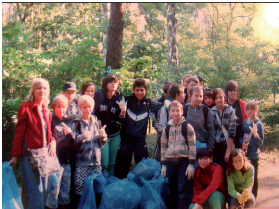
Gimnazjaliści porządkują las...

Uczestnictwo w konkursie wiąże się z wykonaniem wielu prac porządkowych w lesie, jak i działaniami w szkole, oczywiście związanymi z lasem. Gimnazjaliści porządkowali oraz sadzili las. Realizowane zadania z edukacji leśnej zawarte zostały w programie, utworzonym specjalnie dla potrzeb uczniów naszej