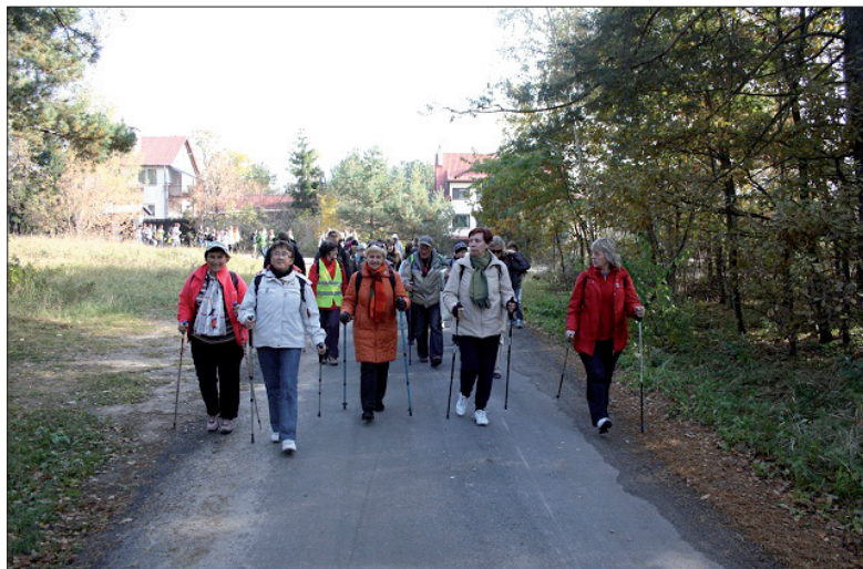
Członkowie PTTK na trasie do Palmir

podczas której turyści i harcerze opiekujący się Miejscami Pamięci Narodowej zostali odznaczeni, organizatorzy otrzymali gratulacje od władz państwowych, delegacje złożyły wieńce, zapaliliśmy znicze. A potem wyruszyliśmy na Cmentarz w Palmirach – który jest symbolem martyrologii, oporu naszych przodków i dowodem pamięci naszego pokolenia. Na cmentarzu zastaliśmy mrok, rozświetlony setkami zniczy i pochodni. Apel poległych wprowadził nas w nastrój szczególny. Wspominaliśmy bezprzykładne męstwo polskich rycerzy w 1420 roku oraz ich następców: żołnierzy walczą-