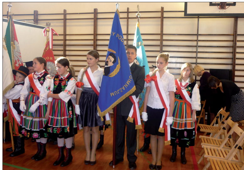
Delegacja uczniów ze szkoły w Solcu podczas XIV Złoty Szkół Reymontowskich w Warszawie

ny Reymontowskiej, a mamy już tak duże osiągnięcia. Cieszy nas to, że nasza młodzież ma możliwość rozwijania i pogłębiania swoich zainteresowań, promowania języka polskiego w kraju i za granicą oraz propago-