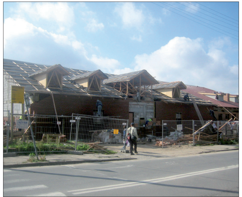
Market Netto w budowie