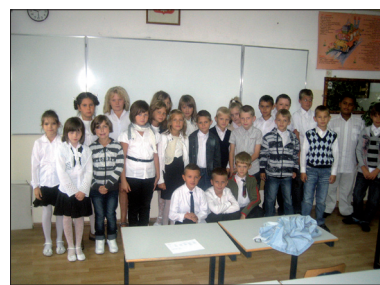
Nasz klasa III d

zabaw dla dzieci, który powstaje przy naszej szkole w ramach rządowego programu Radosna Szkoła. Natomiast na „dni nie pogody” przygotowaliśmy dla uczniów klas O-III sale zabaw, a dla uczniów klas IV-VI – kącik prasowy oraz muzyczny w wydzielono-