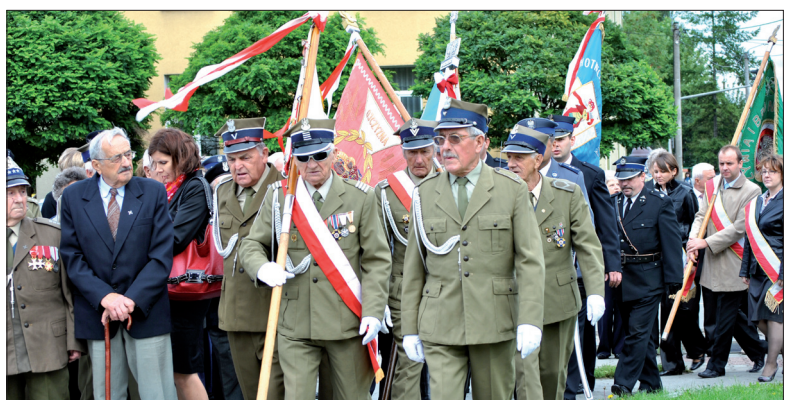
Delegacja kombatantów biorąca udział w uroczystości