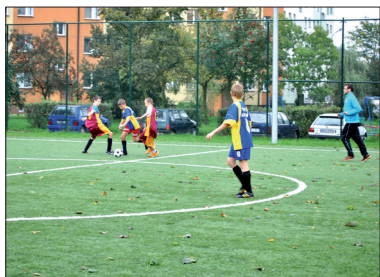
Uczestnicy etapu powiatowego podczas gry

W dniach od 10 września do 23 października br. zaplanowany został na kompleksach „Moje Boisko-Orlik 2012” Turniej Orlika o Puchar Premiera Donalda Tuska. Impreza skierowana jest do dziewcząt i chłopców w dwóch kategoriach wiekowych: 10-11 lat i 12-13 lat. W rozgrywkach startują reprezentacje szkół, jak również tzw. „dzikie” drużyny.