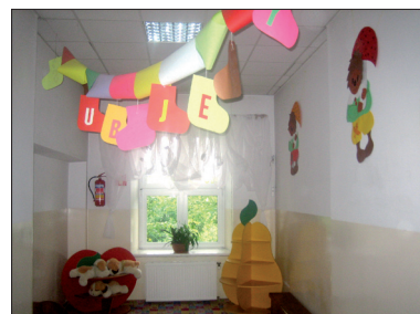
Kącik zabaw czeka na najmniejszych

Ciekawostką jest fakt, że w klasie IV – dzieci nawiązują kontakty z dziećmi (rówieśnikami) III Świata. Sprawują wówczas „opiekę” nad wybranym uczniem, co także przekłada się na wymiar edukacyjny. Jest to adopcja na odległość. W ten sposób – uczniowie naszej szkoły – zapoznają się z problemami dzieci innych narodowości. Obecnie uczniowie klasy IV korespondują z rówieśnikiem, który pochodzi z Kamerunu. Składają się także na pomoc finansową dla swojego „podopiecznego”, który jako analfabeta – musiał odpracować miesiąc czasu u pisarza plemiennego, za to – że napisał mu list do naszych uczniów. Proces oraz harmonogram wykonywanych czynności, które powinny obejmować „współpracę” z rówieśnikiem III Świata – obejmuje program „Międzynarodowy Program – Szkoły Globalne”.