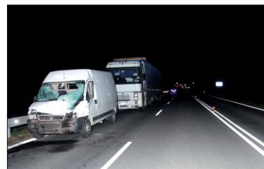
Wypadek spowodowany przez łosia

wypadku poważnych obrażeń ciała doznała 45-letnia pasażerka fiata ducato. Natomiast zderzenia z samochodami nie przeżył łoś.