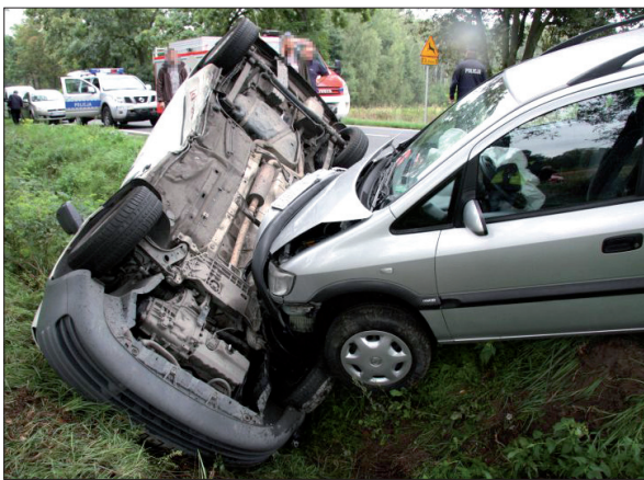
Wraki samochodów po zderzeniu