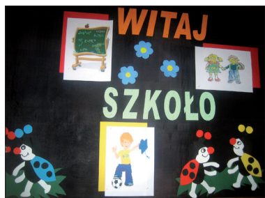
Witaj szkoło, żegnajcie wakacje!

Po raz kolejny pierwszego września zabrzmiał znów dzwonek inaugurujący następny rok szkolny, czyli 2010/2011. Licznie zgromadzeni uczniowie wraz z ro-