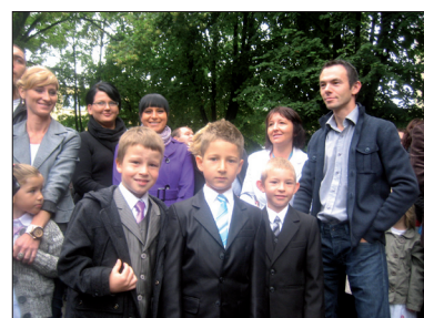
Pierwszoklasiści na galowo

Miniony rok był mniej liczbeny niż obecny, ale w roku szkolnym 2010/2011 zauważyłam pewną ten-