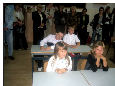
Znów w ławeczkach

Obecna podstawa programowa umożliwia dzieciom 6-letnim rozpoczęcie nauki w kl. I na poziomie do-